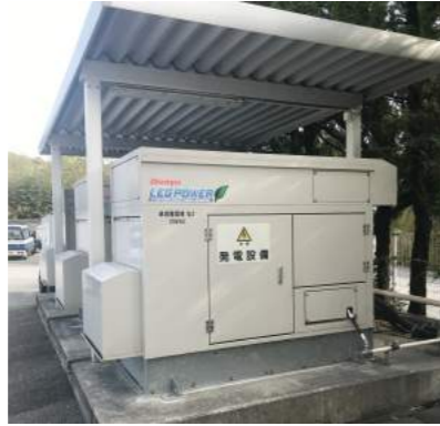
停電時、電気を供給する発電機の設置。