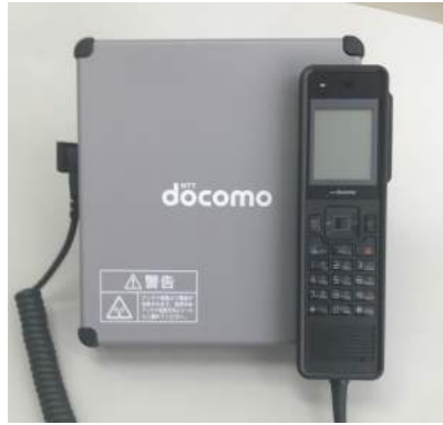
災害時においても外部と連絡がとれる衛星回線電話。

否確認システムを運用し、すぐに緊急・復旧対応がとれるよう、あらかじめ社内では取り決めています。さらに大規模災害時等において、重要なライフラインであるLPガスが安定的に被災地に供給できるように、災害時に対応できる設備を充実させています。国からも災害時対応中核充填所として認定されています。