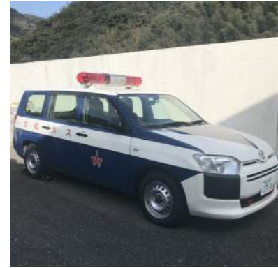
災害時や緊急時に現場へいち早く急行することが可能な緊急用車両。